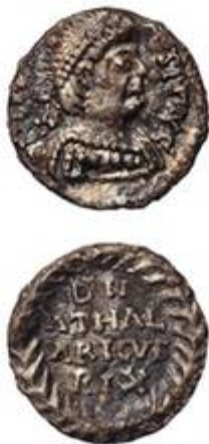
Abb. 117 Krefeld-Gellep. Siliqua des Ostgotenkönigs Athalarich (526 - 534).

Grab 32 mit cella memoriae liegt am Südrand eines kleineren, fast quadratischen Gräberfeldabschnittes, der durch deutliche Freiräume gegen die größtenteils gleichzeitig belegten Nachbarabschnitte abgegrenzt ist. Dessen Belegung beginnt Ende des 3. Jahrhunderts und setzt sich bis in die späte Merowingerzeit hinein fort. Bemerkenswert ist aber, dass hier anders als in der Nachbarschaft nahezu alle Gräber des 4. Jahrhunderts - von Münzen abgesehen - keine Beigaben mehr enthielten. Dies gilt auch für die von der Ausrichtung her abweichenden Gräber aus konstantinischer Zeit , die ansonsten aber in Gellep zu 70 - 80 % verhältnismäßig reich ausgestattet erscheinen. Ob es hier einen christlichen Hintergrund gibt, muss mangels sicherer Anzeichen offen bleiben. Anzunehmen ist