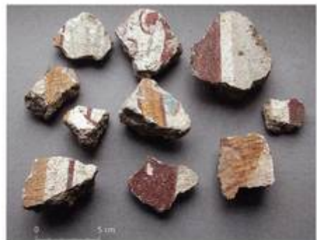
Abb. 115 - 116 Krefeld-Gellep. Bemalter Wandputz aus der Schuttgrube über Grab32.

Die Nachuntersuchung der Schuttgrube über Grab 32 förderte noch einigen Polychrom bemalten Wandputz zutage ( Abb. 115 - 116 ). Ferner fanden sich viele Reste des sehr starken Unterputzes sowie Brocken von grobem Mauermörtel und Baumaterial. Dieses war meist kleinteilig und trat in der Menge gegenüber dem Mörtel stark zurück; große, gut verbaubare Steine fehlten. Dies lässt den Schluss zu, dass der Abbruch